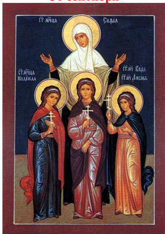
Мцц. Веры, Надежды, Любови и матери их Софии (ок. 137).

Святые мученицы Вера, Надежда и Любовь родились в Италии. Их мать, святая София, была благочестивой вдовой-христианкой. Назвав своих дочерей именами трех христианских добродетелей, София воспитывала их в любви ко Господу Иисусу Христу. Святая София и дочери ее не скрывали своей веры во Христа и открыто исповедовали ее перед всеми. Наместник Антиох донес об этом императору Адриану (117-138), и тот велел привести их в Рим. Понимая, зачем их ведут к императору, святые девы горячо молились Господу Иисусу Христу, прося, чтобы Он послал им силы не утрачиться предстоящих мук и смерти. Когда же святые девы с матерью предстали перед императором, все присутствовавшие изумились их спокойствию: казалось, что они были званы на светлое торжество, а не на истязания. Призывая по очереди сестер, Адриан убеждал их принести жертву богине Артемиде. Юные девы (Вере было 12, Надежде - 10 и Любви - 9 лет) оставались непреклонны. Тогда император приказал жестоко истязать их: святых девиц жгли на железной решетке, бросали в раскаленную печь и в котел с кипящей смолой, но Господь Своей Невидимой Силой хранил их. Младшую, Любовь, привязали к