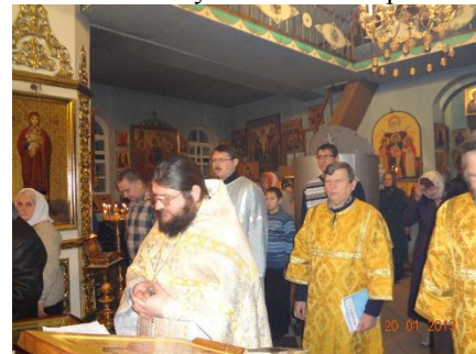
Прихожане набирали Божоявленную воду