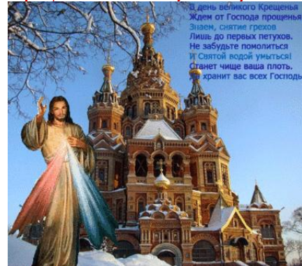
Молебны звучали во всех храмах